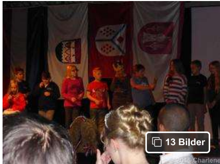
Die Kartoffel steht im Mittelpunkt des Bühnenprogramms