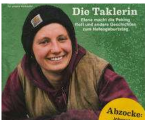
AB MITTWOCH auf dem Lohbrügger Markt !! von Erich Heeder