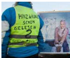
SIE kommt spät - aber sie KOMMT !! von Erich Heeder